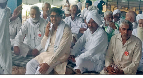
उच्छाना। अतिरिक्त मंडी में धरना दे रहे किसान संगठन।