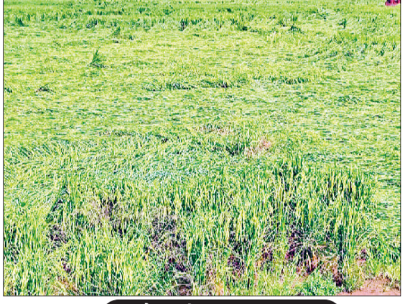
राजौड़। मौसम के अचानक बदलाव ने खेतों में गिरावट दर्ज की गई।

पश्चिमी विक्षोभ के चलते दूसरे दिन मंगलवार को भी मौसम के तेवर बिगड़े रहे। किसानों की सांसें अटकी रही और माथे पर चिंता की लकीरें साफ देखने को मिलीं। उन्हें भय सताता रहा कि कहीं मौसम के बिगड़े तेवर उनकी फसलों को चौपट न कर दें। दिनभर आकाश में बादल छाए रहे और हलकी बारिश भी हुई। जिससे किसानों की सांसें अटकी रही। धान फसल की कटाई का कार्य बाधित रहा। तापमान में गिरावट दर्ज की गई। पिछले 24 घंटों के दौरान औसतन जिले में 12 एमएम बारिश दर्ज की गई। सबसे ज्यादा बारिश जुलाना 27 एमएम दर्ज की गई। मंगलवार को अधिकतम तापमान 27 डिग्री तथा न्यूनतम तापमान 19 डिग्री दर्ज किया गया। मौसम में आद्रता 82 प्रतिशत तथा हवा की गति छह