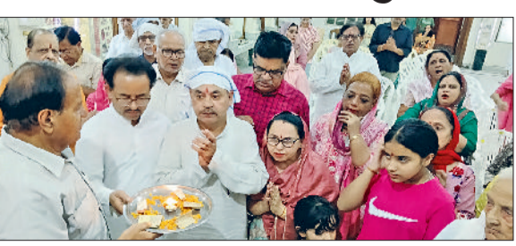
जींद। माता वैष्णवी धाम में पूजा करते हुए श्रद्धालु।