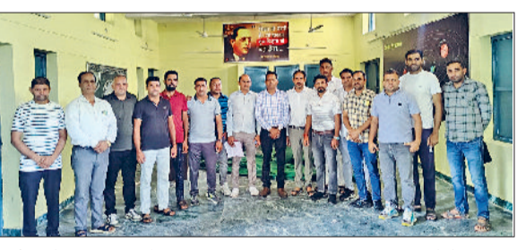
राजौड़। रोष प्रदर्शन करते हुए।

■ आज कंयूटर लेब अटेंडेंट कर्मचारी मायूस और निराश