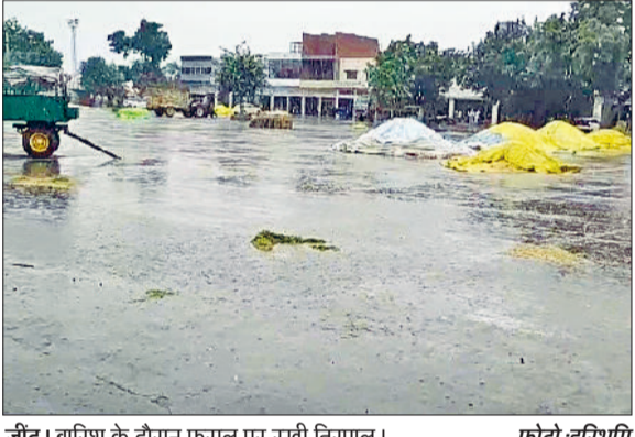
जींद। बारिश के दौरान फसल पर रखी तिरपाल।