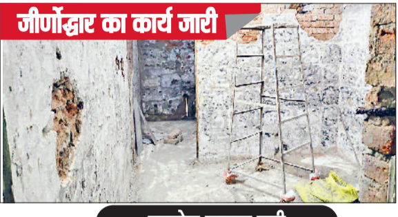
जीर्णोद्धार का कार्य जारी

जिला मुख्यालय स्थित नागरिक अस्पताल में ठेकेदार कारिदों द्वारा पुरानी बिल्डिंग में जीर्णोद्धार के कार्य के चलते एक साथ सभी शौचालयों को उखाड़ दिया है। जिससे उपचार के लिए आने वाले मरीजों और उनके तीमारदारों खासकर महिलाओं को भारी परेशानी का सामना करना पड़ रहा है। इस लापरवाही के कारण पुरानी बिल्डिंग में एमरजेंसी के पास एक भी शौचालय खुला नहीं है। वहीं शव गृह के पास बनाए गए शौचालय पर तो ताले लटके हुए हैं। ऐसे में मरीजों को शौच के लिए इधर-उधर भटकना पड़ रहा है। नागरिक अस्पताल की पुरानी बिल्डिंग में 15.90 करोड़ रुपये की लागत से जीर्णोद्धार कार्य चल रहा है। इस दौरान मजदूरों ने सभी शौचालयों को एक साथ तोड़ दिया। जिससे शौच करने की कोई जगह नहीं बची है।