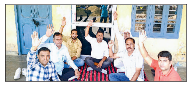
पूंड़ी। हैफेड प्रबंधन के खिलाफ नारेबाजी करते कर्मचारी।

■ कोऑपरेटिव मार्केटिंग सोसायटी यूनियन कर्मचारियों ने की नारेबाजी